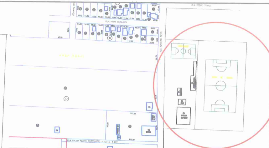
Detalhe nº 2 Fechamento sob viga