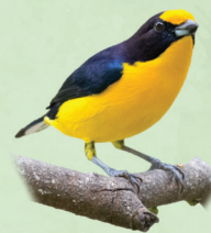
Gaturamo Euphonia violacea