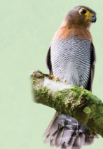
Falcão-caburé Micrastur ruficollis