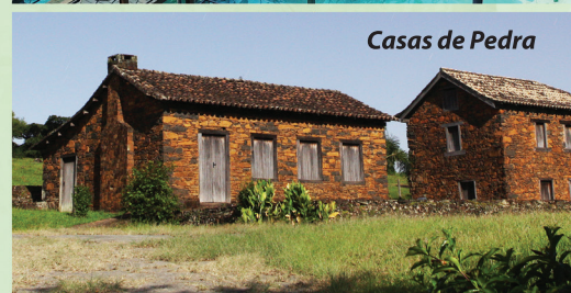
Casas de Pedra