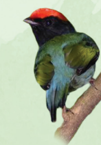
Tangará Chiroxiphia caudata