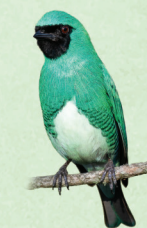
Sai-andorinha Tersina viridis