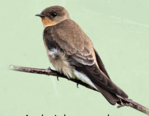
Andorinha-serradora Stelgidopteryx ruficollis