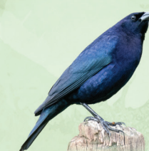
Chupim Molothrus bonariensis