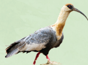
Carucaca Theristicus caudatus