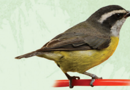
Cambacica Coereba flaveola