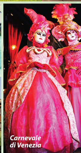
Carnevale di Venezia