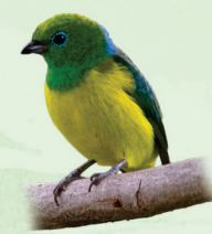
Gaturamo-bandeira Chlorophonia cyanea