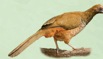
Aracuã Ortalis squamata