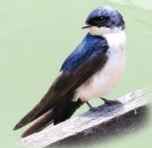
Andorinha-pequena-de-casa Pygochelidon cyanoleuca