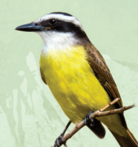
Bem-te-vi Pitangus sulphuratus