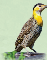
Pica-pau-do-campo Colaptes campestris