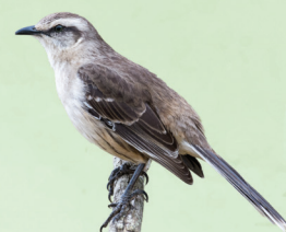
Sabiá-do-campo Mimus saturninus