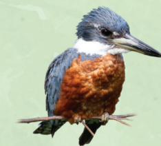
Martim-pescador-grande Megasceryle torquata