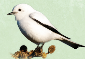
Noivinha Xolmis irupero