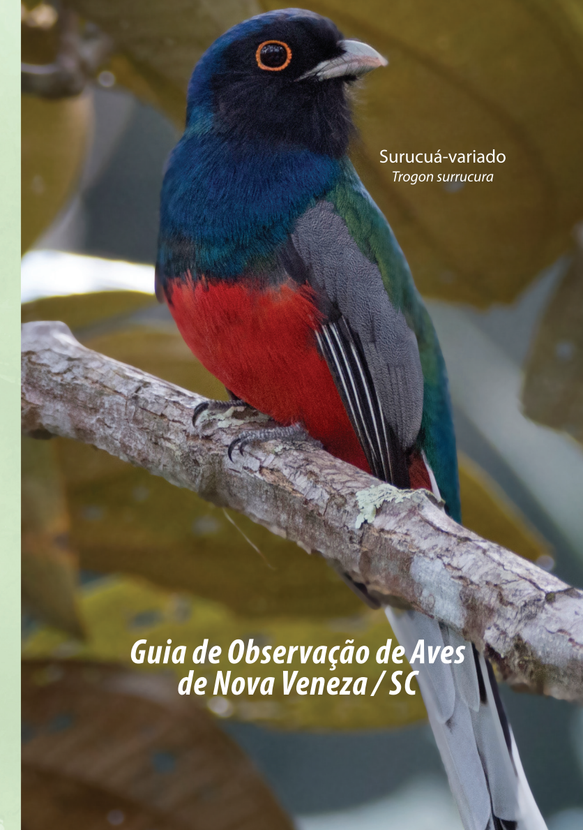
Surucuá-variado Trogon surrucura

Guia de Observação de Aves de Nova Veneza / SC