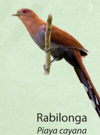
Rabilonga Piaya cayana