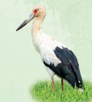
Maguari Ciconia maguari