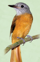
Capitão de saíra Attila rufus