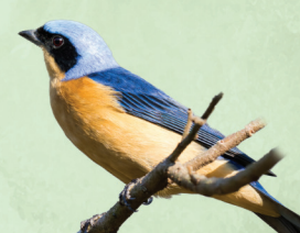
Saíra-viúva Pipraeidea melanonota