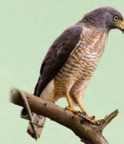
Gavião-carijó Rupornis magnirostris