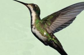
Beija-flor-de-veste-preta Anthracothorax nigricollis