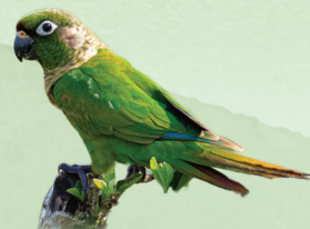
Tiriba Pyrrhura frontalis