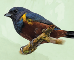
Ferro-velho Euphonia pectoralis