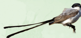
Tesourinha Tyrannus savana