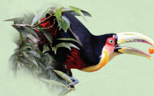
Tucano-de-bico-verde Ramphastos dicoloris