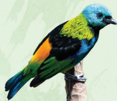
Saíra-sete-cores Tangara seledon