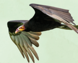
Urubu-de-cabeça-amarela Cathartes burrovianus