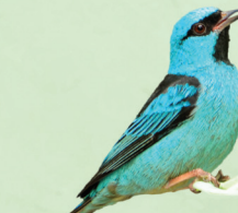
Sai-azul Dacnis cayana