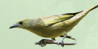
Sanhaço-do-coqueiro Thraupis palmarum