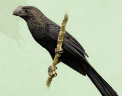
Anu-preto Crotophaga ani