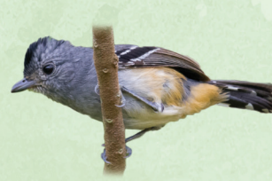
Choca-da-mata Thamnophilus caerulescens