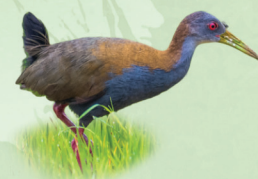
Saracura-do-mato Aramides saracura