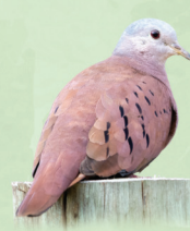
Rolinha-roxa Columbina talpacoti