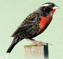
Polícia-inglesa-do-sul Sturnella superciliosa