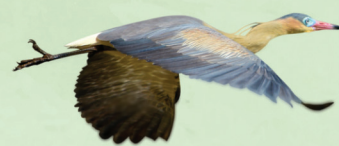
Maria-faceira Syrigma sibilatrix