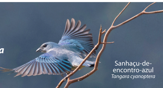
Sanhaçu-de-encontro-azul Tangara cyanoptera

Capital Nacional da Gastronomia Italiana