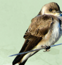
Andorinha-do-campo Progne tapera