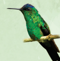
Beija-flor-de-fronte-violeta Thalurania glaucopis