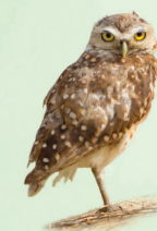
Coruja-buraqueira Athene cucularia