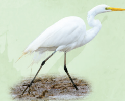
Garça-branca Ardea alba