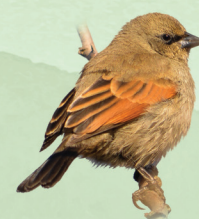
Asa-de-telha Agelaioides badius

Agradecimentos à equipe FUNDAVE – Fundação de Meio Ambiente de Nova Veneza e a ANET – Associação Neoveneziana de Turismo.