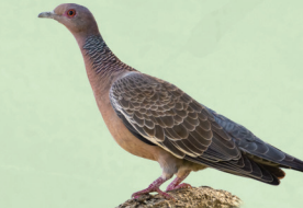
Asa-branca Patagioenas picazuro