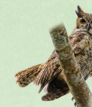
Jacurutu Bubo virginianus