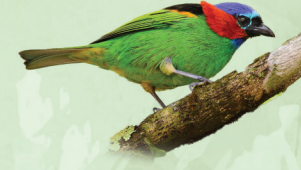
Saíra-militar Tangara cyanocephala