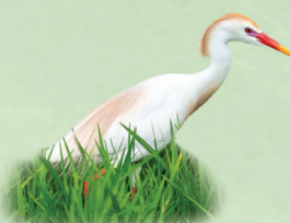
Garça-vaqueira Bubulcus ibis