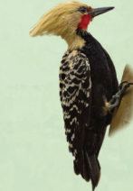
Pica-pau-de-cabeça-amarela Celeus flavescens