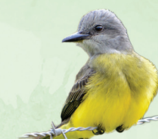
Suiriri Tyrannus melancholicus