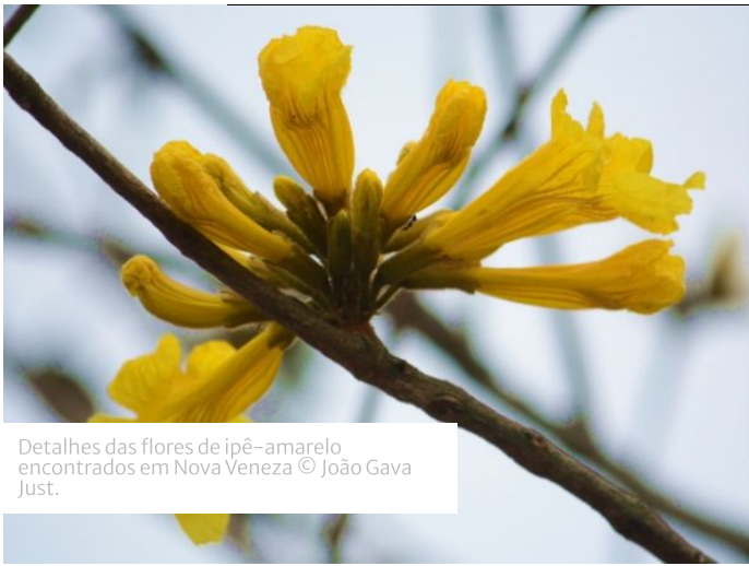
Detalhes das flores de ipê-amarelo encontrados em Nova Veneza © João Gava Just.