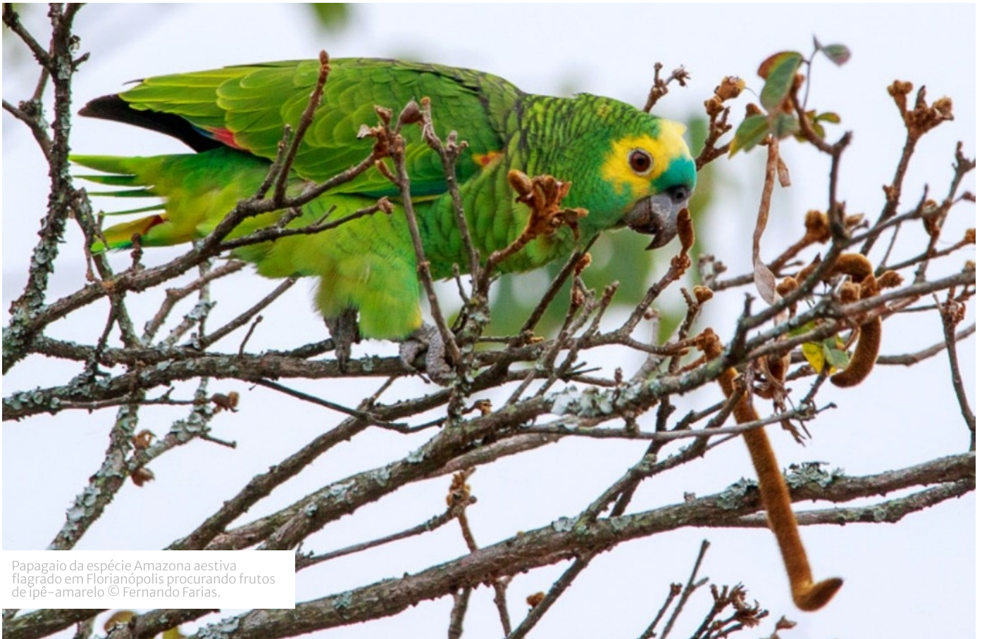
Papagaio da espécie Amazona aestiva flagrado em Florianópolis procurando frutos de ipê-amarelo © Fernando Farias.

Além de embelezar nossas praças, quintais, ruas e sítios, os ipês-amarelos também são muito atrativos para a fauna. Durante o período da sua floração, que ocorre no inverno, existe uma grande oferta de alimento e as aves aproveitam essa abundância de flores para se fartarem. Algumas, como os beija-flores, procuram pelo seu néctar, enquanto outras, como os sanhaços e periquitos, se alimentam das pétalas. Em alguns locais, até mesmo os grandes e duros frutos dos ipês são aproveitados por aves de bicos fortes, como os papagaios, os tucanos e as araras.