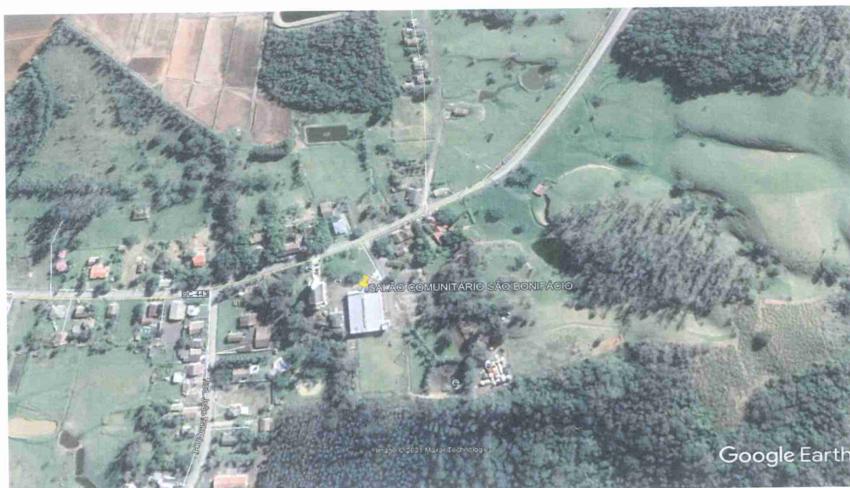
Imagem Nº1: Local da intervenção- Lat: -28.718880- Long: -49.594321

O presente memorial descritivo tem por finalidade, discriminar os materiais e estabelecer as normas para complementar o Centro Comunitários da Comunidade São Bonifácio com 1.193,00 m 2 de área global construída, locado na RUA JOÃO RAMPINELLI - SÃO BONIFÁCIO - NOVA VENEZA- SC, 88868-000 .